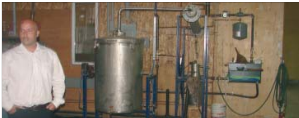
Mis en production l'an dernier, les bouilloires servant à extraire les huiles essentielles de certaines plantes fonctionnent rondement dans le cadre de la phase 2 du projet de laboratoire rural menée par la Coopérative forestière de Girardville.

Ces travaux peuvent être entrepris par suite des recherches menées par le biologiste Fabien Girard. Ce dernier a pu non seulement identifier les caractéristiques et le potentiel de certaines plantes, mais a colligé une série d'informations quant aux méthodes de cueil-