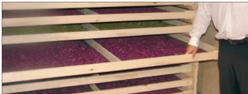
Les installations de CFG situées à l'entrée du chemin forestier au nord de Girardville, servent aussi au séchage de certaines plantes, pour la production d'épices servant dans la réalisation de plats culinaires.

Les travaux de la phase du projet portent aussi sur le développement de la 2ième transformation. On cherchera à évaluer la fabrication et la rentabilité de produits comme les huiles de massage, les sels de bain, les décongestionnants et les baumes, en plus de certaines application culinaires.