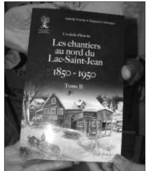
Le volume « Les chantiers au nord du Lac-Saint-Jean 1850-1950 », décrit la vie et les façons de faire pour exploiter la forêt dans notre coin de pays.

L'ouvrage est disponible aux bureaux de la Société d'Histoire et de Généalogie Maria-Chapdelaine, aux Librairies Centrale et Myrtille de Dolbeau-Mistassini, à la ville de Dolbeau-Mistassini. D'autres endroits seront connus au cours des prochaines semaines, où l'on pourra se procurer le volume.